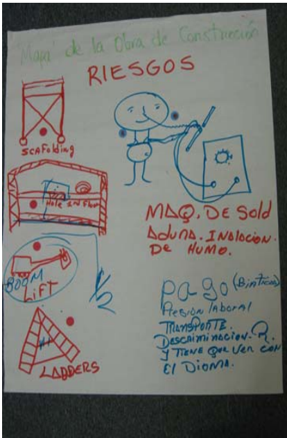
Mapeo de riesgos elaborado por los trabajadores durante las actividades de valoración de riesgos desarrolladas